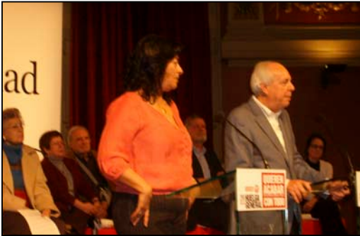
Almudena Grandes y Eduardo Mendicutti.